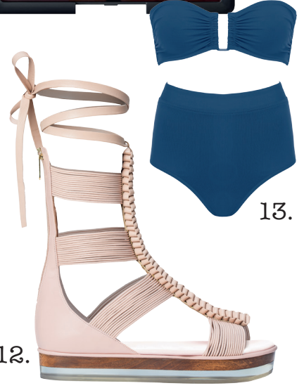
1. Orecchini, Prada. 2. Espadrillas con laccio, Manebi. 3. Top in pizzo e gonna alla caviglia per l'abito da sposa, Yolán Cris. 4. e 7. Decoro auto e lunga tavolata con tealight e limoni dell'agenzia di wedding planner Sugokui Events Capri, www.sugokui-events.com. 5. Borsa, Fendi. 6. Occhiali, Giorgio Armani Eyewear. 8. Orgasm Blush, Nars Cosmetics. 9. e 11. Una proposta food e la magica vista del Relais & Châteaux Caesar Augustus Hotel ad Anacapri. 10. Barchette decorative a origami, agenzia wedding planner Capri Wedding. 12. Sandali alla schiava, Vionnet. 13. Bikini a vita alta, Eres.